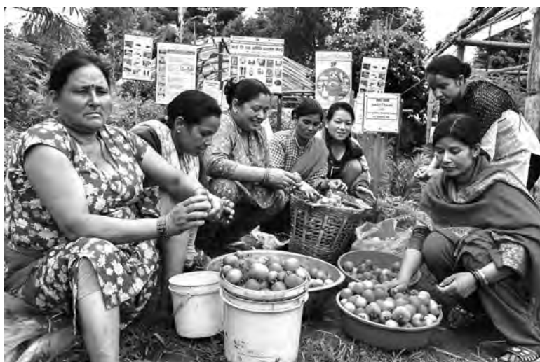
गोलभेडा खेतीमा महिला

संयुक्त राष्ट्रसंघले चीनको बेइजिङमा आयोजना गरेको चौथो विश्व सम्मेलन १९९५ महिला अधिकारका दृष्टिकोणले महत्वपूर्ण मानिन्छ । जसको उपहारका रूपमा बेइजिङ कार्ययोजना पारित गरिएको थियो । यो कार्ययोजनाले महिलाउपर हुने सबै प्रकारका