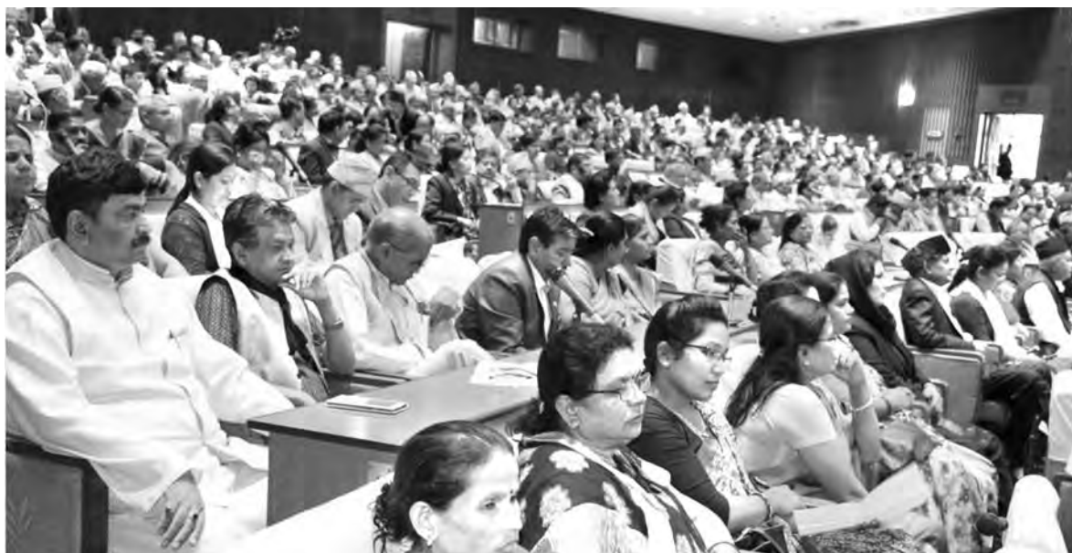
संसद् भवन, काठमाडौं