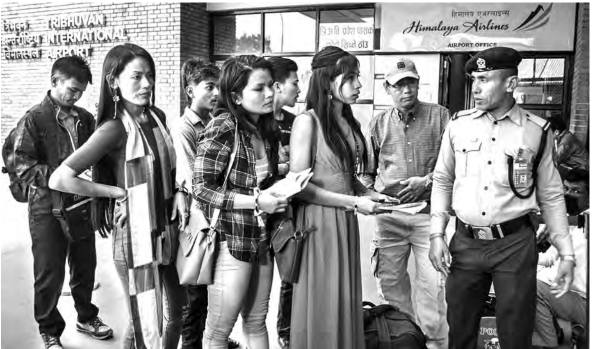
रोजगारका लागि विदेश उड्न तयार युवति त्रिभुवन अन्तर्राष्ट्रिय विमानस्थलमा।

हाल श्रम स्वीकृति लिएर वैदेशिक रोजगारमा जानेमा सबैभन्दा बढी प्रदेश नम्बर १ बाट २५.५१ प्रतिशत, त्यसपछि प्रदेश २ बाट २४.१० प्रतिशत, प्रदेश नम्बर ३ बाट १६.०७ प्रतिशत, प्रदेश नम्बर ४ बाट १३.१ प्रतिशत, प्रदेश नम्बर ५ बाट १३.०१ प्रतिशत, प्रदेश नम्बर ५ बाट १६.२६ प्रतिशत, प्रदेश