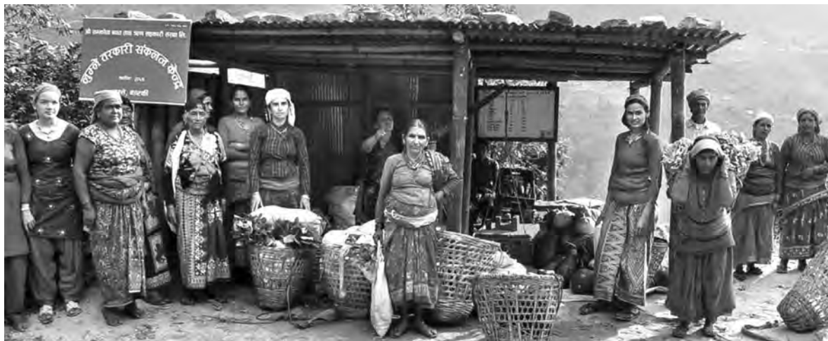
मुलुके तरकारी संकलन केन्द्र, कास्कीमार्फत् तरकारी उत्पादन गरिरहेका महिला ।